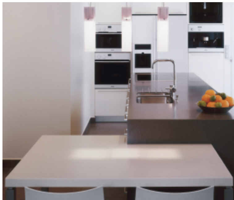
Design Sofie Lewyllie