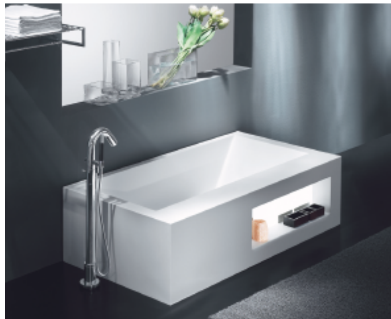
Design Giampiero Peia/Cisal