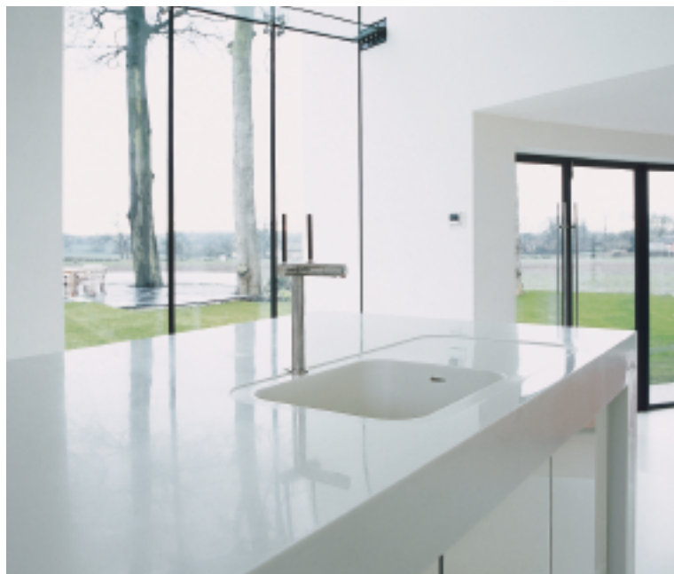
Design Ellis Williams Architects

Optimera design och funktion med Corian®.