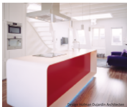
Design Hofman Dujardin Architecten