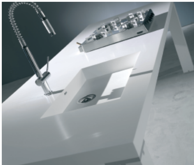
Design Lino Codato/Mathias