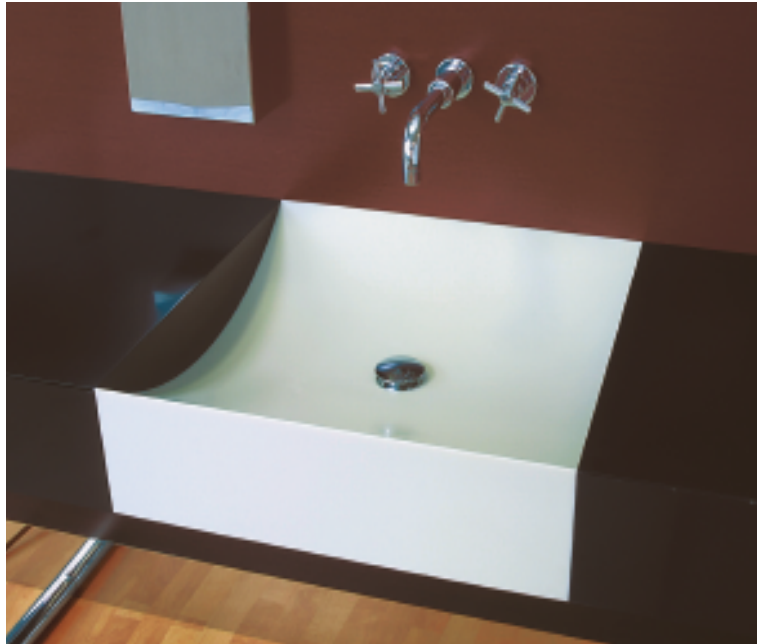
Design Massimo Fucci

Det är ditt badrum. Våga något nytt med Corian®.