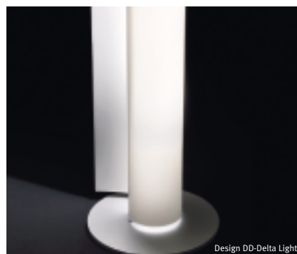
Design DD-Delta Light