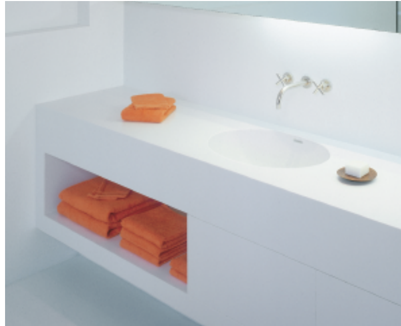
Design Sofie Lewyllie