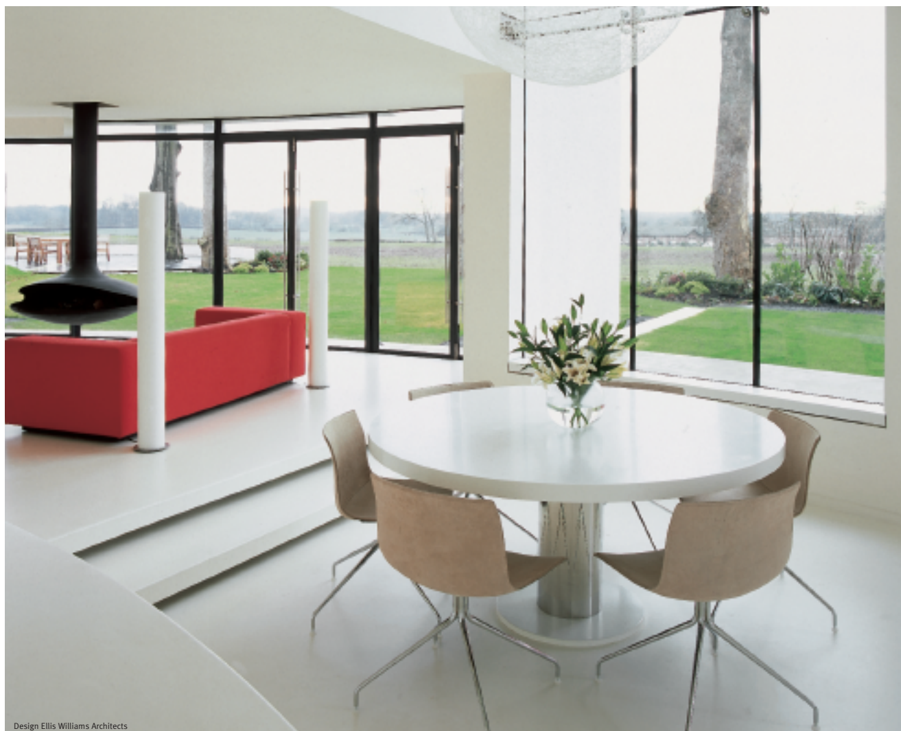
Design Ellis Williams Architects