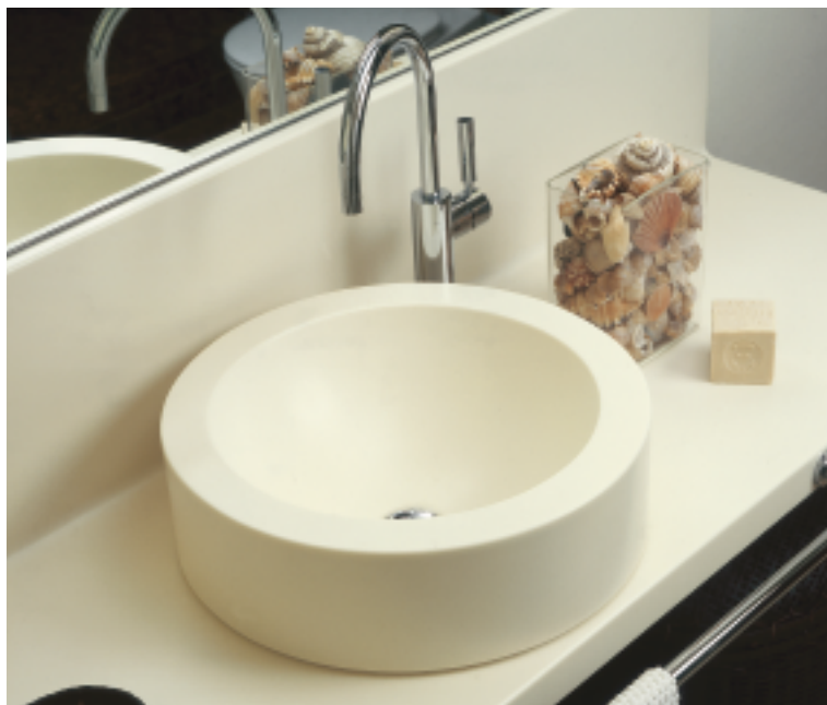
Design Massimo Fucci